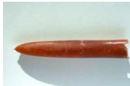
Belemnitella mucronata (von Schlotheim, 1813). Campanien - Vendeuil (02)